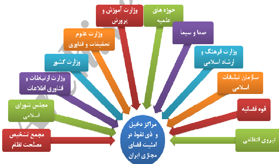
شکل شماره (۴): مراکز دخیل و ذی‌نفوذ در امنیت فضای مجازی ایران

به مقوله امنیت در فضای مجازی می‌توان از دیدگاه‌های مختلفی پرداخت، می‌توان امنیت اخلاقی، فرهنگی، اقتصادی و یا حتی سیاسی را در آن بررسی نمود و یا از جنبه فنی به امنیت در فضای سایبر نگاه کرد، در این بخش سعی می‌کنیم سازمان‌ها و نهادهایی که در امنیت فضای مجازی از جنبه‌های گوناگون دخیل هستند را به اختصار بررسی نماییم.