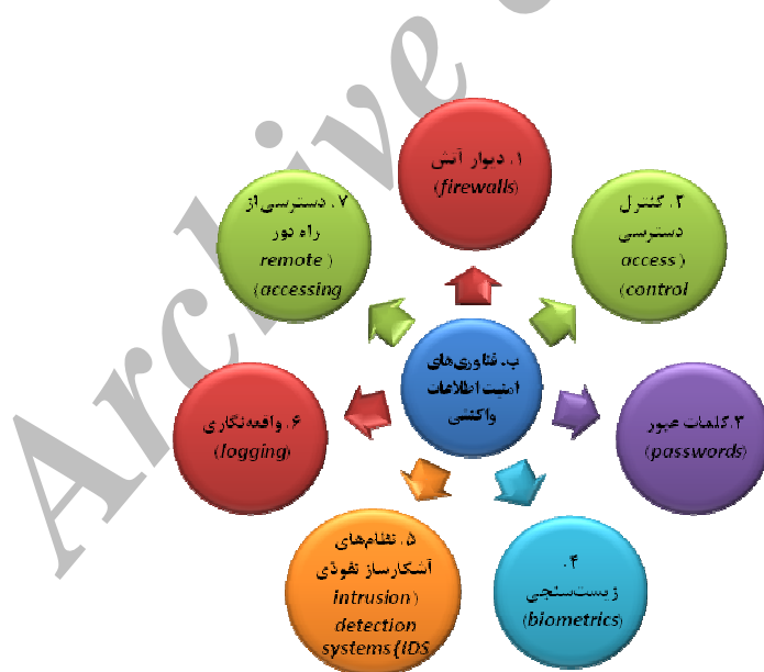
شکل شماره (۲): فناوری‌های امنیت اطلاعات واکنشی