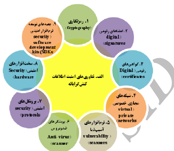
شکل شماره (۱): فناوری‌های امنیت اطلاعات کنش‌گرایانه